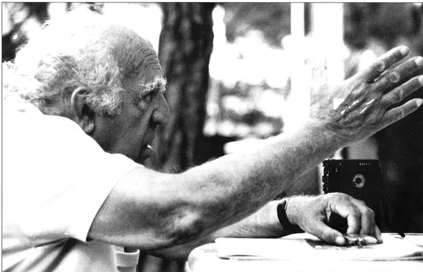
«AVUI ENCARA NO S'HA FET CAP LLIBRE SOBRE LA PROTOHISTÒRIA HISPÀNICA COM EL DE BOSCH GIMPERA.»

dir és que hi ha molta gent treballant en l'àmbit de l'arqueologia. A la meua època érem quatre gats. El problema és que hi ha bastants estudiants i pocs llocs de treball. La Generalitat, malgrat que ha organitzat els arqueòlegs territorials i que ha fet una distribució del país en zones i amb responsables, es veu ofegada per les troballes casuals. D'altra banda, hi ha una baixa en ajudes als programes d'investigació. La universitat se n'ha de fer càrrec, s'han de buscar subvencions privades. La Generalitat ajuda, però no com ho hauria de fer. L'arqueologia es fa molt ben feta. Salvem les coses que s'han de salvar, però en canvi no es poden fer programes seriosos d'investigació. Jo havia proposat la creació d'un Institut Català d'Arqueologia, perquè la Generalitat té unes atribucions molt concretes de tipus legal: autorització per a les excavacions, protecció i difusió dels jaciments, permisos, controls..., però no té programes d'investigació. Les subvencions són cada vegada més reduïdes. Ni la conselleria d'Ensenyament ni la CIRIT no han posat un bloc important per a la recerca. En aquest sentit fallem.