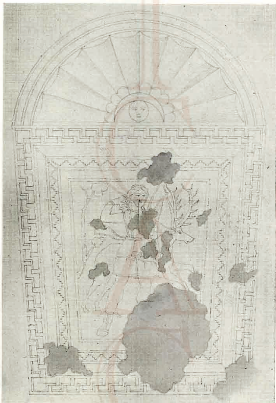
Mosaico romano, hoy desaparecido, con representación de Diana, de Villaber- mudo (Palencia). Dibujo de D. Marcelino de la Vega (1862).