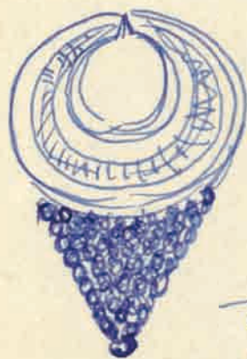
Fig. 9(2). Arcaeta de ouro de San Martin e Auta Arcaetas aparecidas no castro de Candore (Candore) Irixo

paj. 453. lista de los exemplares 13 hallados en Portugal y Galicia.