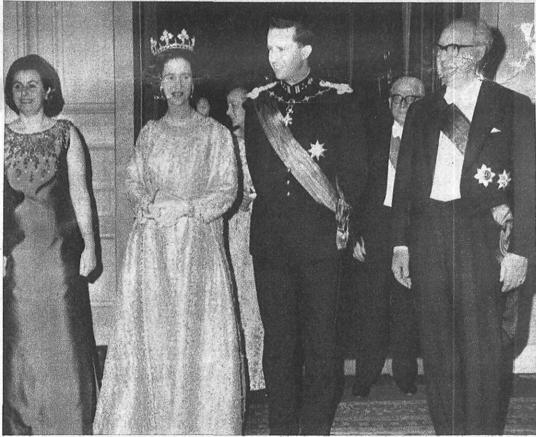
El presidente Saragat ofrece una cena en honor de los Reyes de Bélgica El Presidente de la República italiana y la señora de Saragat han ofrecido una cena en honor de los Reyes de Bélgica, que se encuentran en Roma en visita oficial. En el grabado vemos a los anfitriones y a sus regios huéspedes poco antes de comenzar el ágape