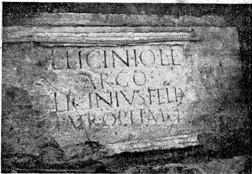
Inscripción de la época romana imperial, en una lápida reaprovechada para cubrir una tumba visigoda, bajo la puerta lateral norte de la basílica

A través de los textos de San Isidoro, conocemos la existencia en el país en tiempos visigóticos de Ordenes monásticas, siendo las más extendidas en el nordeste de la Península, las de San Sergio, y San Victoriano, y hasta el momento, no había sido posible el estudiar arqueológicamente las ruinas de uno de estos monasterios, con una destrucción total en época árabe, posibilidad que parece presentarse en el yacimiento de Bobalá, que más que un «mansum» visigótico, parece que presenta las ruinas de una amplia basílica, con una residencia monacal contigua con pervivencia hasta la época árabe. — Miguel SERRA BALAGUER.